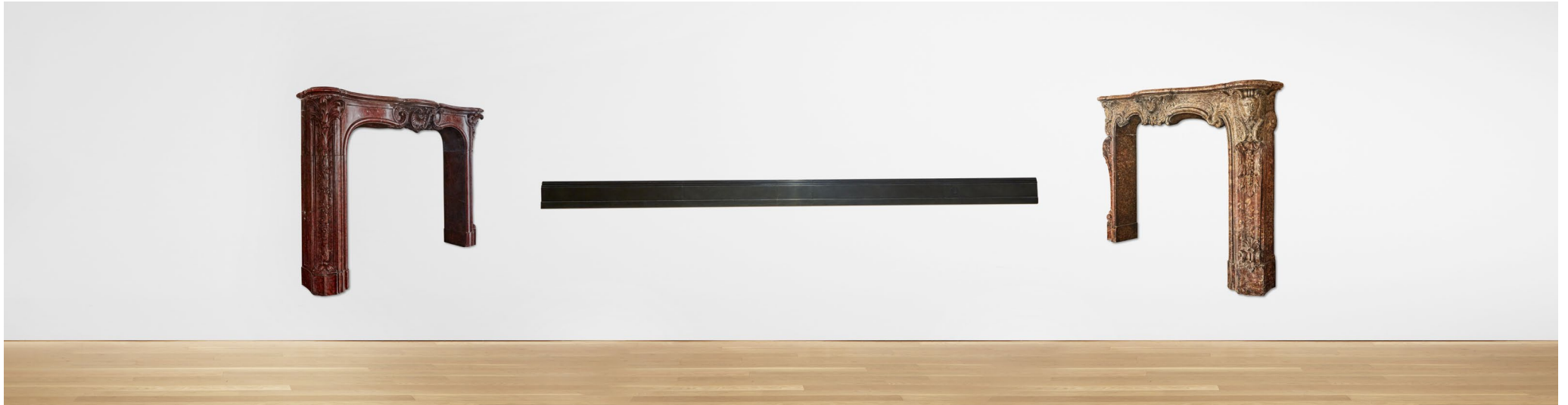
GUILLOTINA (Louvre), 2017 - 2019 Óleo sobre madeira / Oil on wood 235 x 205 x 4 cm; 30 x 561 x 1 cm; 235 x 205 x 4 cm LH-0045